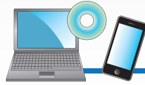
CD-ROM / WEB サイトからインストール