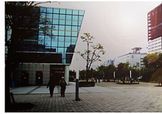
◆WDR機能による撮影 (建物)