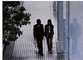
◆WDR機能による撮影 (人物)