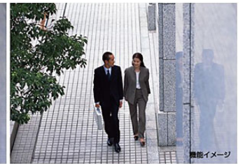
※画像はサンプルイメージです。