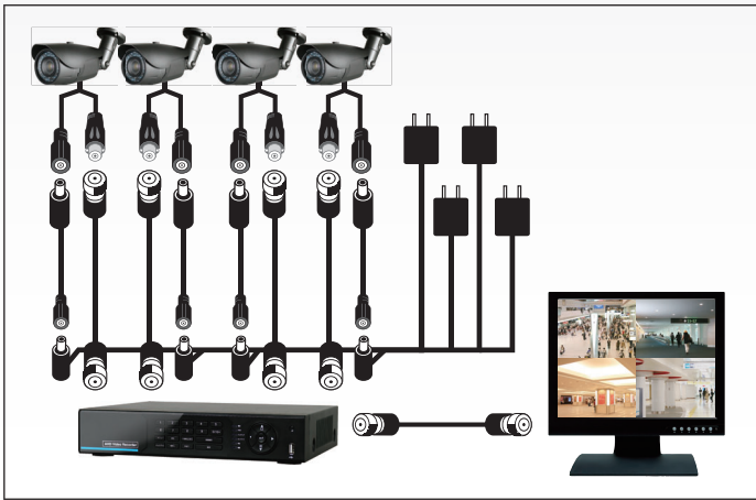
◆通常のカメラ接続