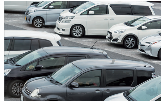
駐車場 不法駐車や車上荒らしの防止に