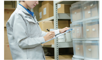
倉庫 物品の管理や盗難防止に