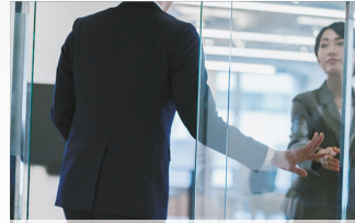
オフィス 業務管理や来客の確認に

Wi-Fiの電波が届く範囲で、電源を確保できる場所であればどこでも設置が可能です。