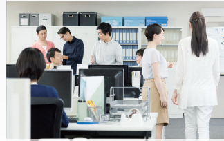
オフィス 業務管理や来客の確認に

Wi-Fiの電波が届く範囲で、電源を確保できる場所であればどこでも設置が可能です。