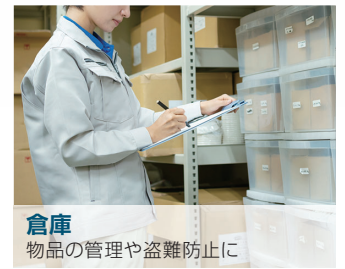
倉庫 物品の管理や盗難防止に