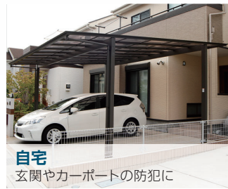
自宅 玄関やカーポートの防犯に