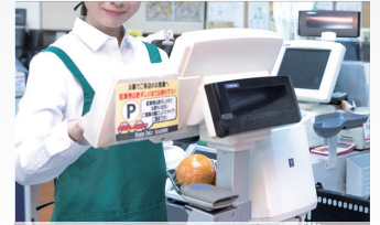
店舗 出入口・レジ周辺の防犯に