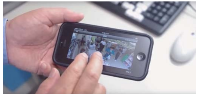
※スマートフォンの映像は実際の監視映像です